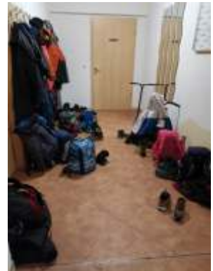
Die Christenlehrekinder fühlen sich im Gemeindehaus wohl.