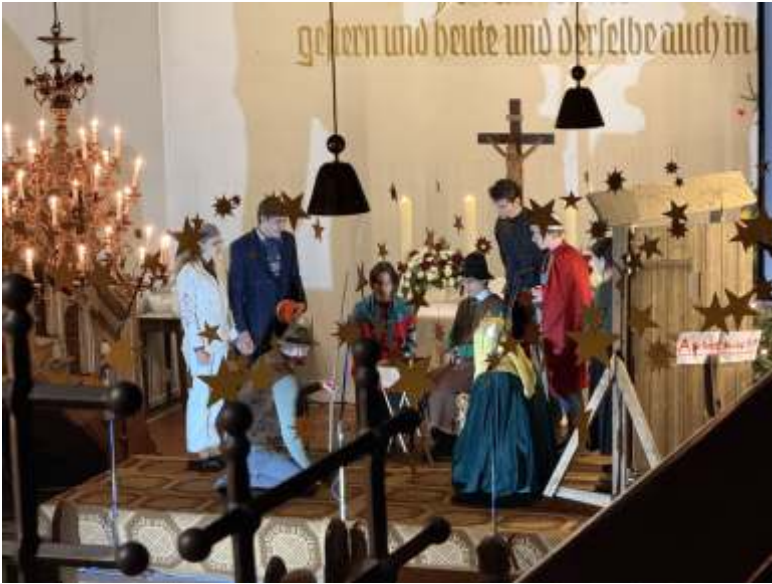
Die letzte Christnacht am Heiligen Abend 2025 wurde wieder von der Jugend musikalisch und schauspielerisch kreativ gestaltet.