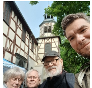
Auf dem Begegnungskirchentag in Jawor am 16. Mai 2026.