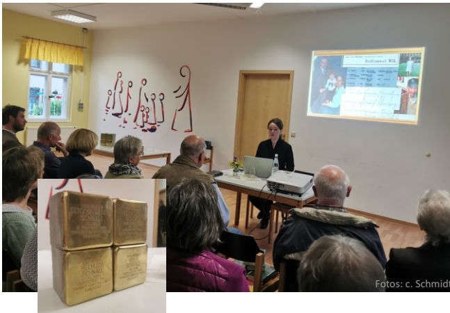
Am 10. Juni erfuhren die zahlreichen Besucher des Gemeindeabends Hintergründe zum Leben jüdischer Mitbürger aus Niesky. Für die vom Nationalsozialismus aus dem Leben gerissenen Menschen wurden am 22. Juni Stolpersteine in Niesky verlegt.