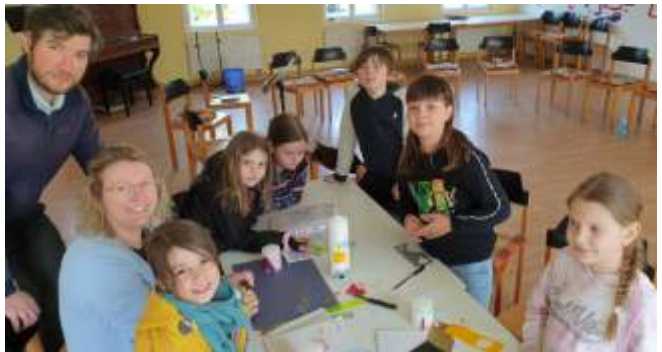
Kerzen basteln in der Christenlehre am 20. April